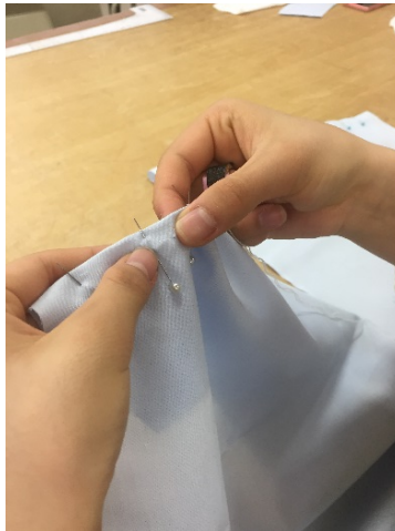
[しつけ糸で仮縫い]