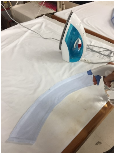
[本縫い、アイロンかけ]