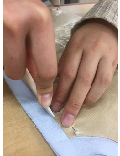
[へらを使って印をつける]