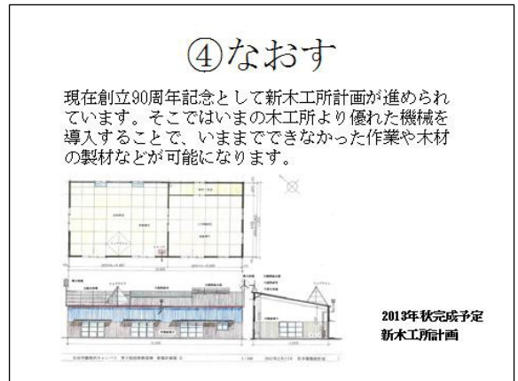
図3・4 展示資料より